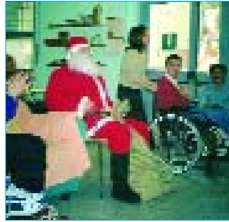
Babbo Natale al cdd

I gruppi "...& FRIENDS" e "VIA VAI"si allenano per lo shopping natalizio girando per negozi.