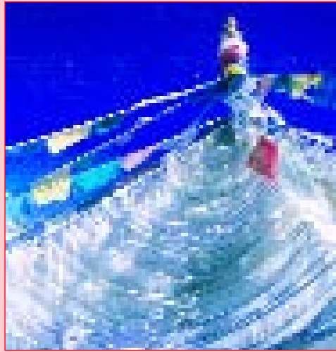
"La linea retta è la linea degli uomini, quella curva la linea di Dio". (Antoni Gaudi)

Non bastano Associazioni, non bastano momenti di solidarietà, necessita sempre che ogni cittadino abbia un piccolo microcosmo del proprio io che ogni giorno possa diventare un microcosmo di un noi.